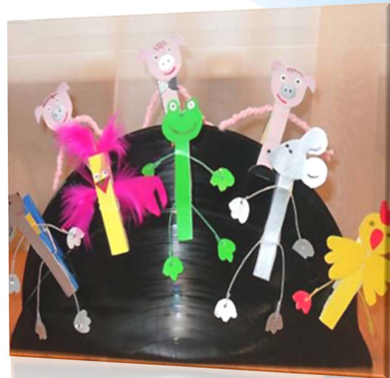
Театр на прищепках