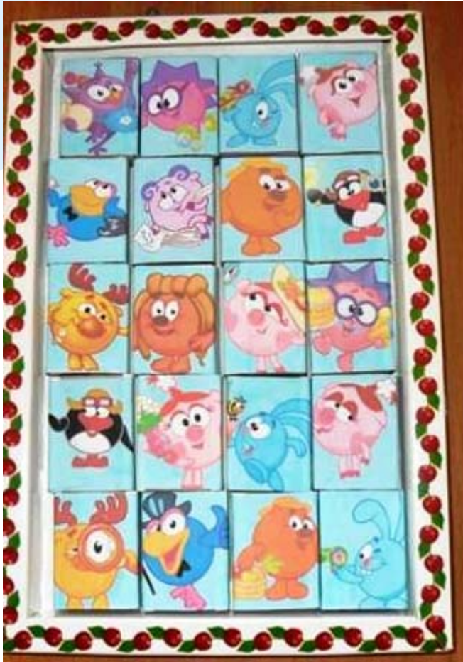
Театр на спичечных коробках